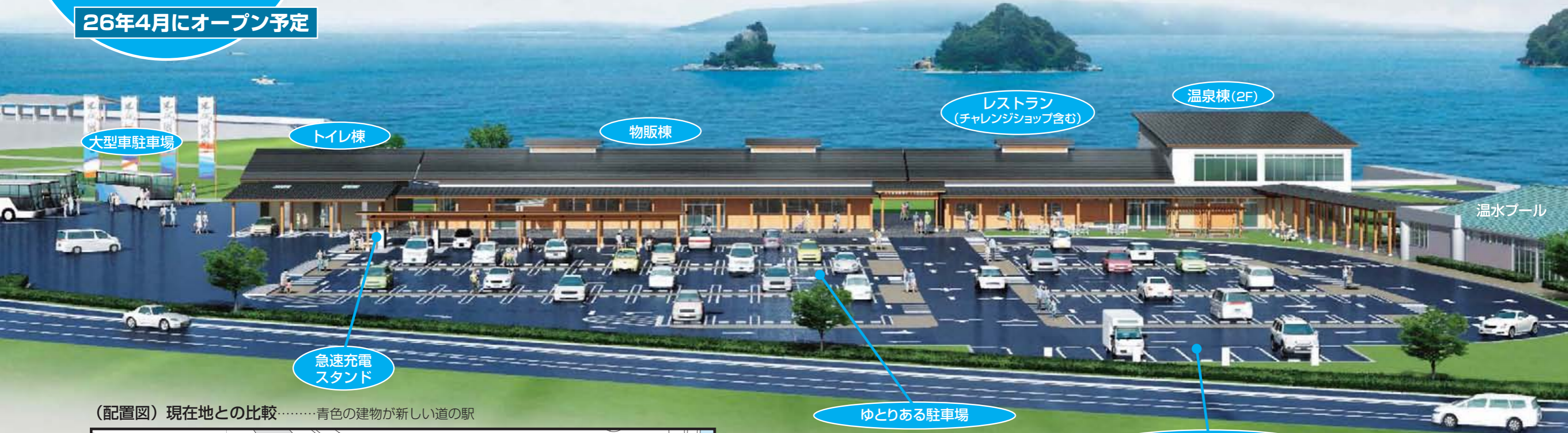
(配置図) 現在地との比較.....青色の建物が新しい道の駅